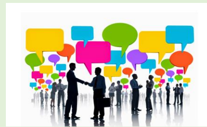
Mesa redonda realizada no Rio de Janeiro reúne especialistas da Fundacentro, Fiocruz e Seconci-Rio para discutir como simplificar a SST no ambiente de trabalho

O Guia traz informações objetiva, simples e inclusiva. A estrutura dos textos é enxuta, onde são usadas frases e parágrafos curtos. Para ela, toda a população tem o direito de entender os assuntos que afetam sua vida cotidiana, desde questões de saúde pública até direitos trabalhistas e sociais. Mas, se existe o direito de saber, de quem é o dever de informar?