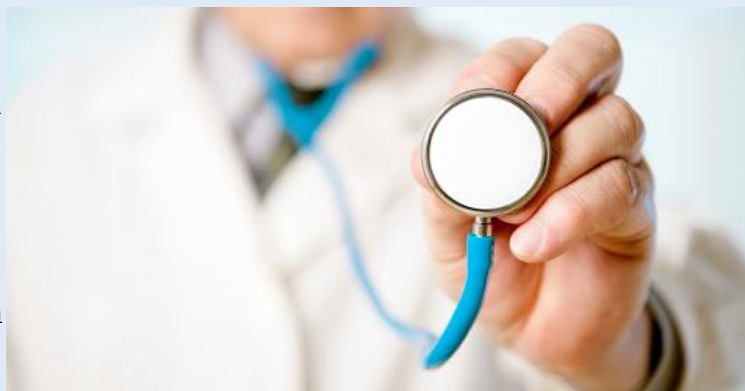
O Médico do Trabalho é uma peça-chave na saúde e segurança do trabalhador

O Médico do Trabalho é uma peça-chave na saúde e segurança do trabalhador, seja em SESMTs ou em consultorias. A formação de excelência, aliada à prática diversificada, garante que esses profissionais estejam preparados para atuar em um mercado exigente, promovendo saúde, prevenindo doenças e contribuindo para a produtividade e o bem-estar das organizações. A procura crescente por especialização é reflexo da relevância estratégica dessa atuação para empresas e trabalhadores. N813 - OHS Consult