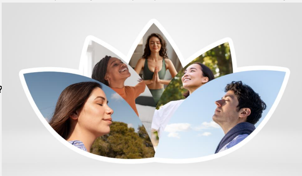
Janeiro Branco: O que fazer pela saúde mental agora e sempre?

números alarmantes, mas também pelo estigma persistente que impede muitas pessoas de buscar ajuda. Dados da Organização Mundial da Saúde (OMS) mostram que o país lidera o ranking de transtornos de ansiedade no mundo e é o segundo com maior número de casos de depressão na América Latina.