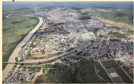
São Mateus, interior do Espírito Santo recebeu o Primeiro Encontro do CREST-ES