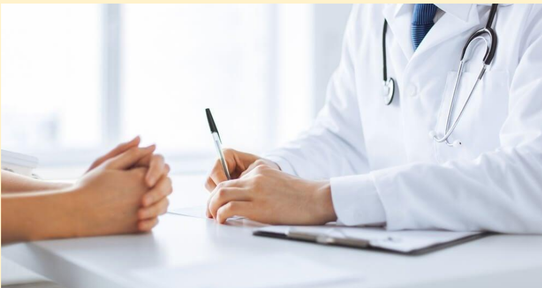
O Decreto nº 69.234, de 23 de dezembro de 2024, instituiu o novo Regulamento de Perícias Médicas e Saúde Ocupacional do Estado de São Paulo. Segundo o governo, este decreto visa regulamentar as perícias médicas e a identificação, classificação e avaliação de unidades e atividades insalubres realizadas pela Diretoria de Perícias Médicas do Estado de São Paulo, o órgão médico oficial do Estado.

- A perícia para fins de posse e exercício deve ser solicitada pelo órgão para o qual o candidato foi nomeado.