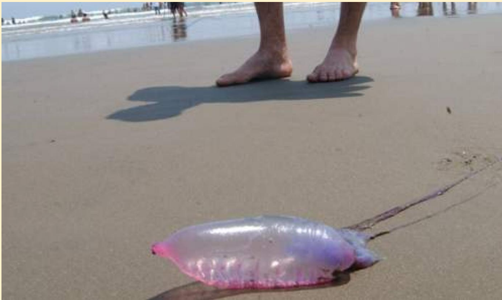
Segundo o Ministério da Saúde, os acidentes causados por águas-vivas e caravelas resultam da ação das toxinas presentes em seus tentáculos

Embora no Brasil as espécies sejam menos perigosas, Soares alerta que há casos graves: "No mundo, algumas águas-vivas, como a vespa-