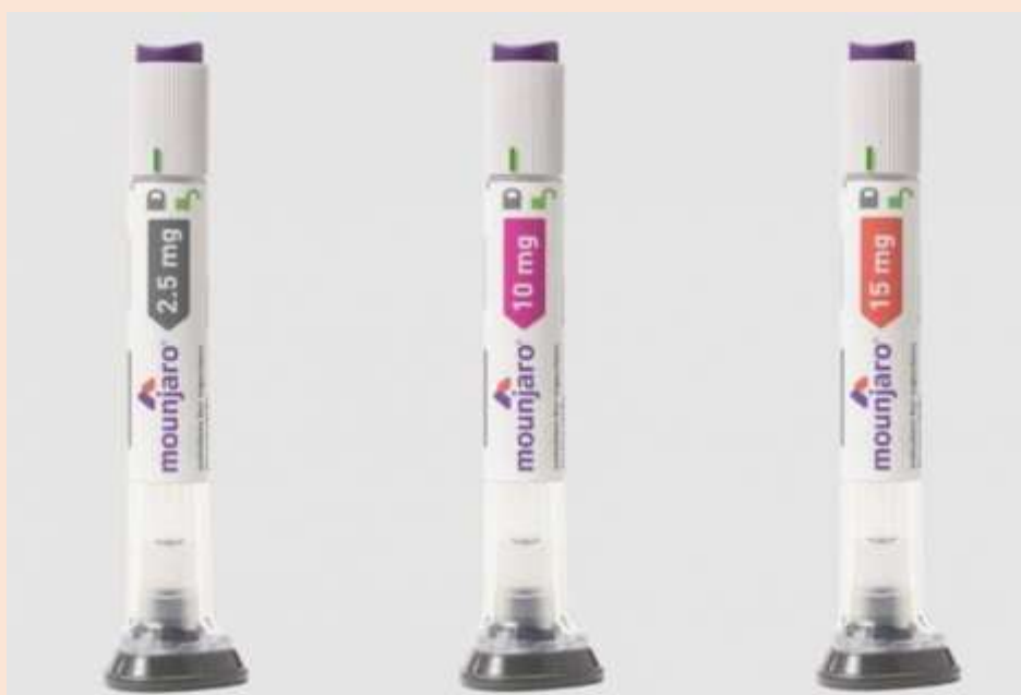
Sem acompanhamento adequado, o Mounjaro pode prejudicar os organismos em formação.

Em resposta ao problema, a agência firmou em 15 de abril uma parceria com os conselhos federais de medicina, farmácia e odontologia para promover o uso racional das canetas emagrecedoras e conter irregularidades na prescrição e dispensação dos medicamentos.