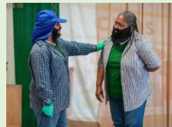
Empenho dos "funcionários atores" mais uma vez fez a diferença no "Abril Verde"

No dia 29 de abril, o grupo se apresentou para o grupo de mulheres da Secretaria de Ação Social, encerrando assim a agenda de abril.