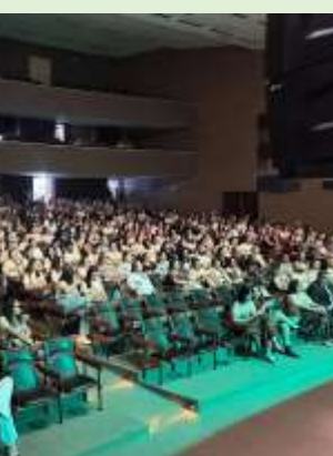
As apresentações cativaram o público

O grupo também apresentou uma peça no município de Montadas-PB no dia 22 de abril, promovendo um show de prevenção e informação para todos os trabalhadores presentes.